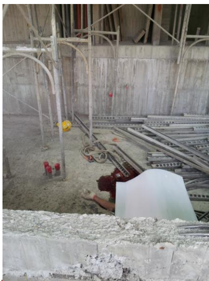
□高雄市政府勞工局勞動檢查處